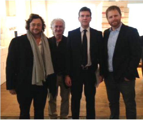
Les représentants des 3 structures fondatrices d'Ecolab Côte d'Azur et M. Arnaud Montebourg, Ministre du redressement productif

"mettre en lumière le secteur de la fabrication numérique personnelle en augmentant sa notoriété au niveau national."